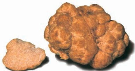
CARPOFORO DI TUBER OLIGOSPERMUM TUL. & TUL.

Questa specie, essendo molto comune, viene spesso raccolta e commercializzata già all'inizio dell'inverno, quando i tartufi sono ancora di colore chiaro e non hanno sviluppato pienamente il loro odore tipico. Se si mescolano le due specie in un'unica partita, il profumo del bianco pregiato prende il sopravvento rendendo pressoché impossibile la distinzione con il tartufo "minore". Lo stesso scambio può avvenire utilizzando un'altra specie di tartufo simile al bianco, il Tuber oligospermum Tul. & Tul., che però non è molto diffusa in Toscana e quindi meno frequentemente entra nei circuiti della commercializzazione locale. Ugualmente può accadere con Tuber asa (Lesp.) Tul. & Tul., un tartufo di ambiente mediterraneo che, se raccolto immaturo,