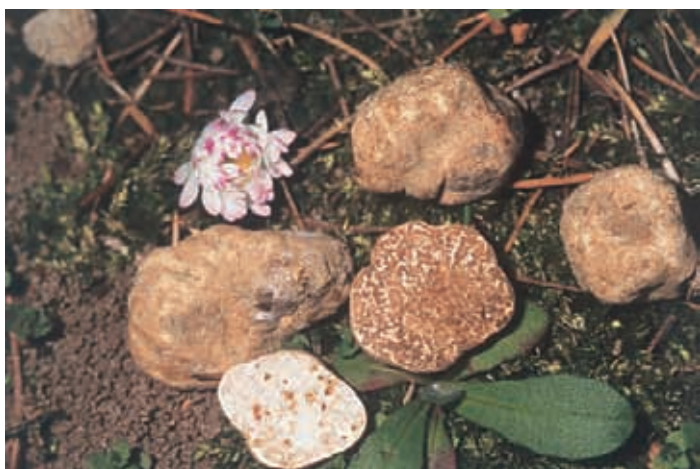
CARPOFORO DI TUBER ASA (LESP.) TUL. & TUL.

può essere scambiato col più pregiato Tuber magnatum . C'è poi un altro fungo ipogeo, la Choiromyces meandriformis Vitt. che, soprattutto da giovane, può essere confuso col tartufo bianco per l'aspetto e per l'odore, che è debolmente fungino.