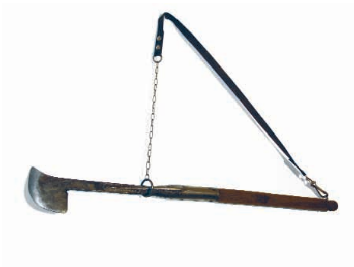
IL "VANGHETTO" LO STRUMENTO UTILIZZATO PER LA RACCOLTA DEI TARTUFI