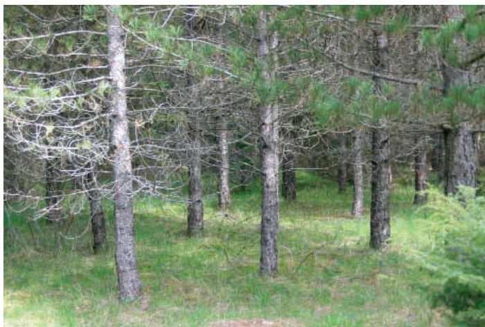
TARTUFAIA NATURALE DI TARTUFO SCORZONE

reni calcarei e sassosi e per le condizioni di forte soleggiamento. Il tartufo nero pregiato si può trovare in boschi radi, in zone al margine fra aree boscate e coltivate o pascolate, oppure su grosse piante isolate. La presenza del tartufo si evidenzia perché sotto le piante produttrici, in genere querce, noccioli e carpini, si crea un'area circolare priva di vegetazione erbacea, detta "pianello" o "bruciata".