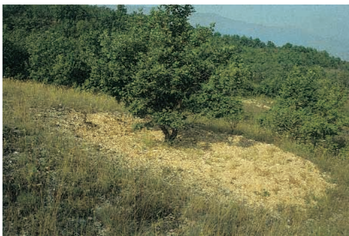
TARTUFAIA NATURALE DI TARTUFO NERO PREGIATO