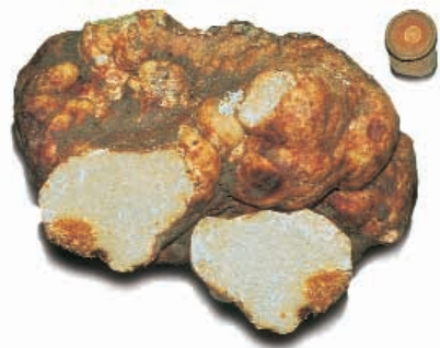
CARPOFORO DI CHOIROMYCES MEANDRIFORMIS VITT.