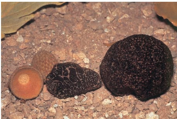
CARPOFORO DI TUBER INDICUM COOKE & MASSEE

tufi, ma che contengono solo il composto principale del profumo del tartufo bianco pregiato (il bis-metil-tio-metano) e si caratterizzano pertanto per un odore fortemente marcato e "monocorde". Sono, purtroppo, largamente impiegati nella ristorazione, grazie ai costi contenuti, spesso per rafforzare piatti "al tartufo" realizzati con tartufi di scarsa qualità. Con la stessa funzione vengono impiegati per commercializzare tartufi immaturi.