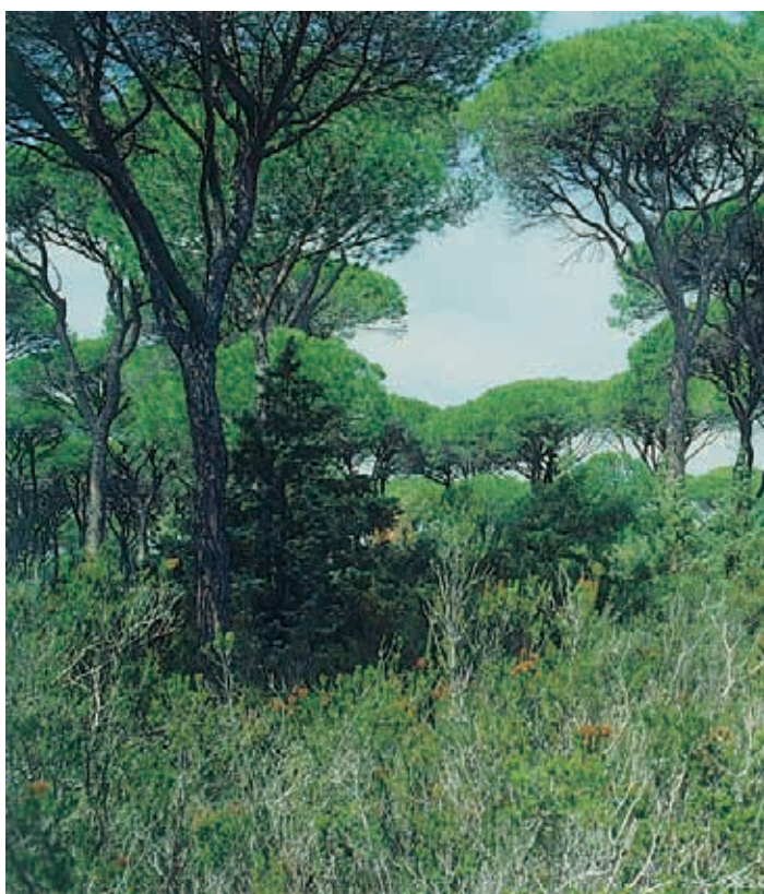
TARTUFAIA NATURALE DI TARTUFO MARZUOLO