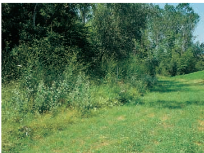
TARTUFAIA NATURALE DI TARTUFO BIANCO PREGIATO

Questo tartufo è presente in maniera sporadica in Toscana e la produzione risulta pertanto piuttosto contenuta. Le tartufaie si caratterizzano per i ter-